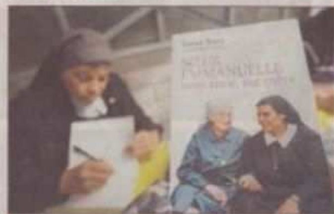
La religieuse a écrit un ouvrage sur son expérience aux côtés de Soeur Emmanuelle.