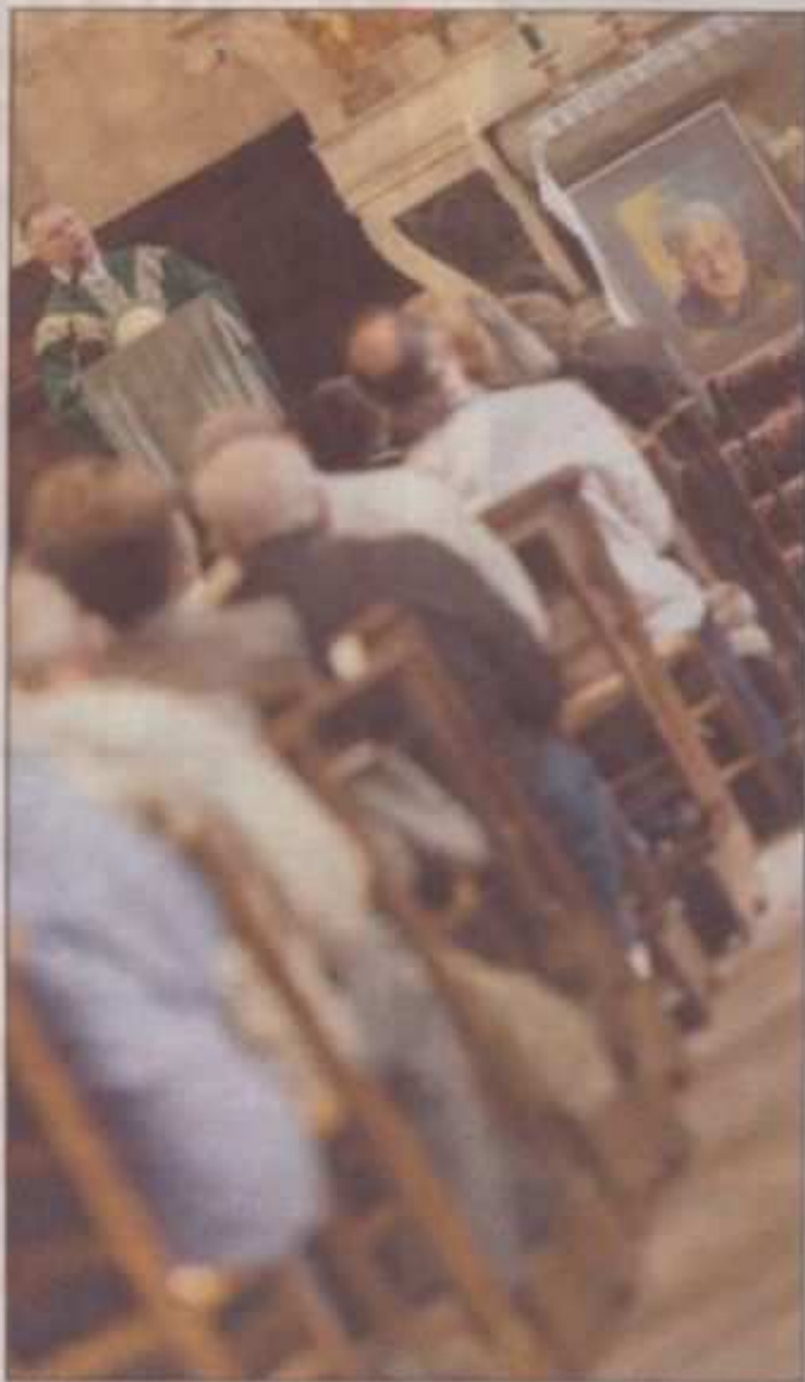
Plus de deux cents personnes ont tenu à rendre hommage, hier, à la « Petite sœur des chiffonniers. »