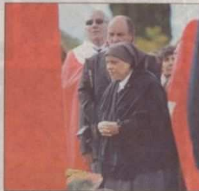
Soeur Sara s'est recueillie sur la tombe de celle avec qui elle a travaillé dix-huit ans.

À l'issue de la messe, tous se sont retrouvés au cimetière du village pour quelques minutes de recueillement sur la tombe de Soeur Emmanuelle. Le souvenir de la sainte femme s'est ensuite poursuivi autour d'un repas dont les bénéfices seront entièrement reversés à ses œuvres.